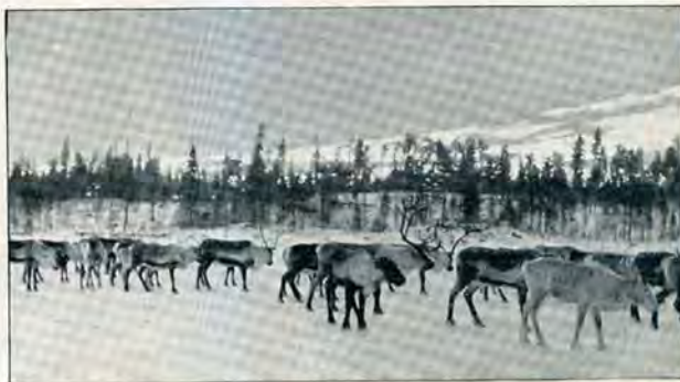
RENHJORD I JÄMTLAND.