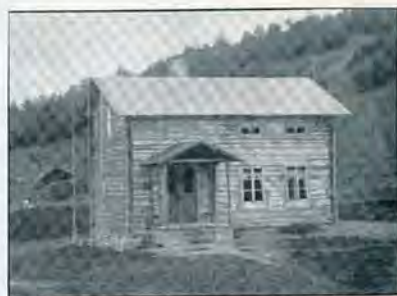
DET TILLFÄLLIGA HEMMET.

För hemmets byggande har köpts en skogig tomt på en avslutningarne i den vackra Undersåkersdalen, ett par km. från Hållands anhaltstation. Och här, litet undan från stråkvägen, hoppas vi att de gamla skola trivas och få ett hem, som de känna som sitt eget, där kärlek och gudsfruktan möta dem under deras sista dagar på jorden.