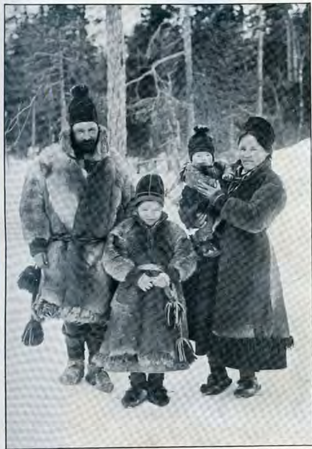
NOMADER I VINTERDRÄKT.

Han är icke stark nog — det gifves ju undantag — att gå in i en jordarbeterses gärning, eller att fylla de tunga timmer-